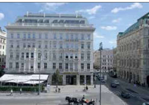
A Sacher Szálloda a bécsi opera mellett található.