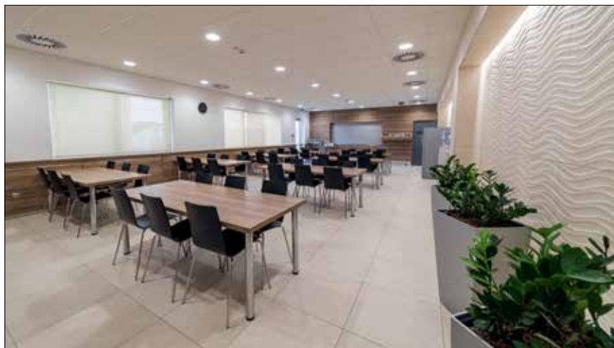
Az új ebédlő a Wiesbauer-Dunahús Kft-nél, Gönyű

A Wiesbauer-Dunahús a termelési-, valamint a szociális tereit úgy alakította ki, hogy azok magas szintű elvárásoknak tegyenek ele- get. Ezek az elvek a Wiesbauer filozófiának megfelelnek: a munka- társak, akik jól érzik magukat és optimális munkakörülmények kö- zött dolgoznak fontos tényezői an- nak, hogy a cég folyamatosan és magas minőségben a legfinomabb termékspecialitásokat szállíthassa a vevői számára.