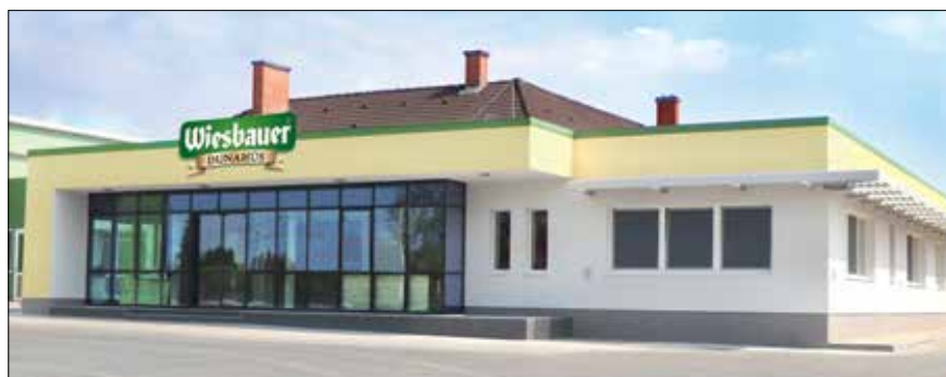
Az újjáépített és kibővített szociális-és irodaépületek

A Wiesbauer-Dunahús, mint mun- kaadó, hogy vonzóbbá váljon a dol- gozók számára különös figyelmet fordított a bővítés során egy új, tágas szociális részleg kiépítésére. A csaknem kétszer akkora étkező kialakítása során a tervezők nem csak a funkcionalitásra összehon- tosították, hanem a dolgozók szü- neteiket is figyelembe véve töre- kedtek nyugodt körülményeket kialakítani, hogy a munkatársak újult erővel tudjanak a munkájuk- hoz visszatérni. A legmodernebb berendezésekkel felszerelt új konyhában a szakács változatos, sokoldalú és egészséges étel-